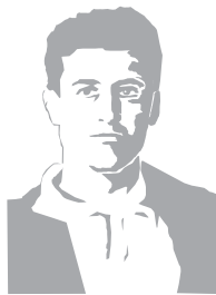
Pier Giorgio Frassati